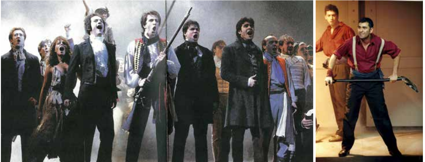
Les Misérables et Titanic

Plus encore que l'AICOM, votre nom est désormais associé à des artistes de renom tels que Lara Fabian ou Les Voca People. Vous avez aussi dirigé les troupes de spectacles aussi populaires que Grease, Un Violon sur le toit ou Chicago, participé à des émissions telles que PopStars (D8) ou La France a un incroyable talent (M6) et mis en scène Anne, le musical ou 1939. Comment êtes-vous parvenu à mener à bien toutes ces aventures à la fois ?